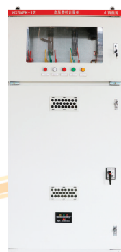
▲HXGNFK-12型高压费控计量柜