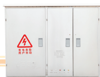
▲低压无功补偿费控装置 ▲户外落地式高压费控装置