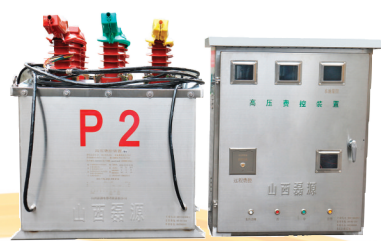
▲杆装式高压费控装置