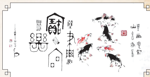
▲金文大篆《壁画瑰宝 仙宫永乐》，已被永乐宫永久收藏。