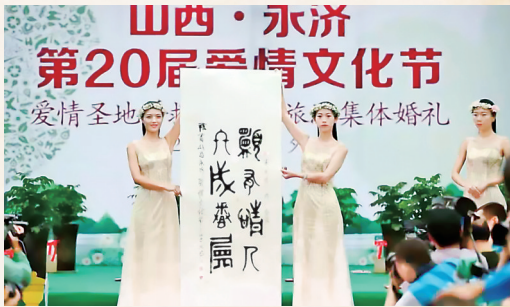
▲金文大篆《愿有情人终成眷属》，已被普救寺景区永久收藏。