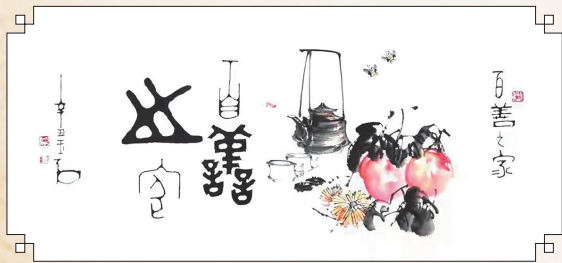
▲▼金文大篆《百善之家》，已被李家大院景区永久收藏。