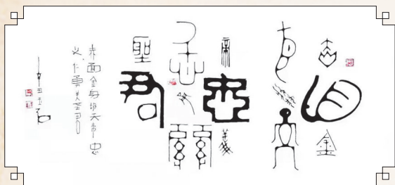
▲▼金文大篆《赤面金身协天帝 忠义仁勇关圣君》，已被解州关帝祖庙永久收藏。