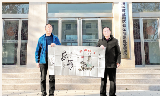
▲金文大篆《华夏首孝》，已被舜帝陵景区永久收藏。