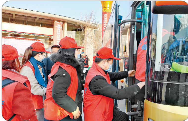
▲外出务工人员乘车出发(资料图)

此外,我市还与多地开展跨区域劳务合作,构建人才交流、信息交换、资源共享机制,在供求对接、组织接受、岗位培训、关心关爱服务等方面共同推进劳务协作,推动了区域间人力资源合理流动、优势互补,实现共同发展。同时,我市的对外(境外)劳务输出已形成一定规模,全市有328人出国务工。