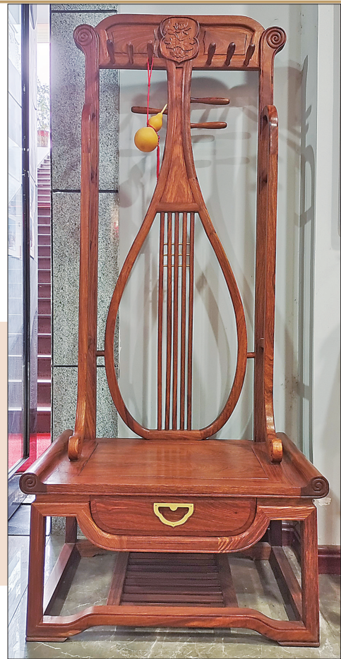
▲“琵琶”造型 尽显古韵

单的衣架，也能让人感受到设计者和工匠的别具匠心。展厅入口处，一个“琵琶”造型的红木产品很是吸睛。仔细一看，这“琵琶”竟是一把椅子的靠背。“琵琶”上的弦轴适比例突出，又不紧挨红木椅背的边框，正好可以挂衣服。“这款家具巧妙的创意设计和精湛的做工，堪称一件艺术品。”程先生说。