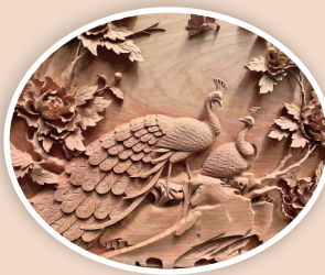
▲浮雕孔雀 活灵活现