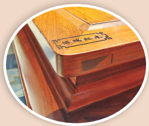
▲榫卯工艺 严丝合缝

如今，博瑞红木家具在保证材料质量和售后服务的条件下，推出“国标红木进万家”活动，根据不同客户的诉求，进行专属定制，免费上门测量、报价、设计，同时郑重承诺终身售后，对产品进行免费保养，解决用户后顾之忧。