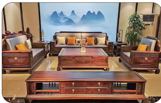
▲简约大气新中式沙发套系