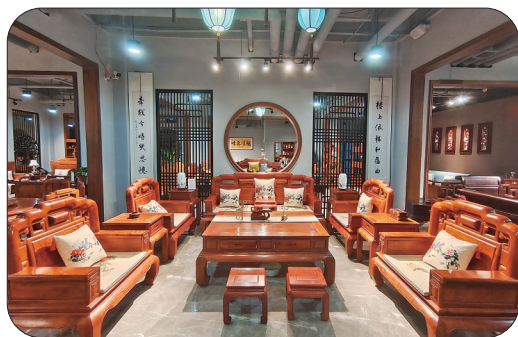
▲刺猬紫檀沙发套系