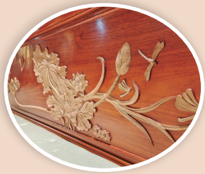
▲古朴润泽 纹角分明