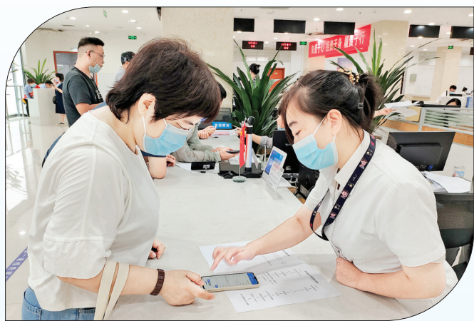
▲市政务服务大厅社保窗口工作人员,为市民介绍线上缴费流程。

据了解,灵活就业人员缴纳企业养老保险的基数,在本省公布的上年度全口径平均工资的60%至300%之间,由缴费人员根据收入状况自主选择申报。缴费比例为20%,其中8%计入缴费人员基本养老保险个人账户。2022年7月份公布的山西省上年度全口径月平均工资为5914元,以此为依据,确定2022年全省参加企业养老保险的缴费基数下限为3548元,上限为17742元。参保人员可从上限与下限之间,自由选择缴费基数。