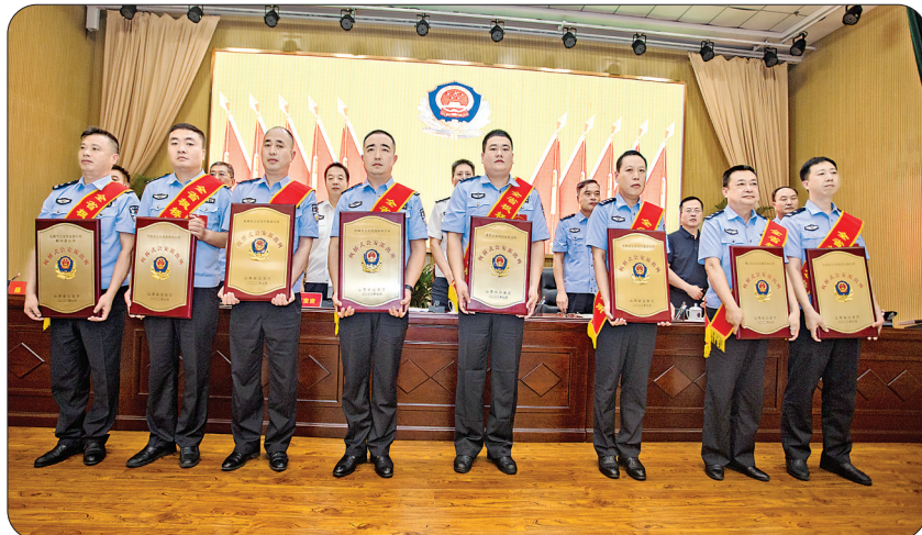
▲为我市获得全省命名的8个“枫桥式公安派出所”授牌

会议要求,全市公安机关要站在战略和全局高度,充分认识派出所基层基础工作和警务机制改革的重大现实意义和深远历史意义,凝神聚力、全警全力,确保派出所各项工作取得更大成效。要切实补齐短板不足,紧盯目标任务筑牢根基,持续推