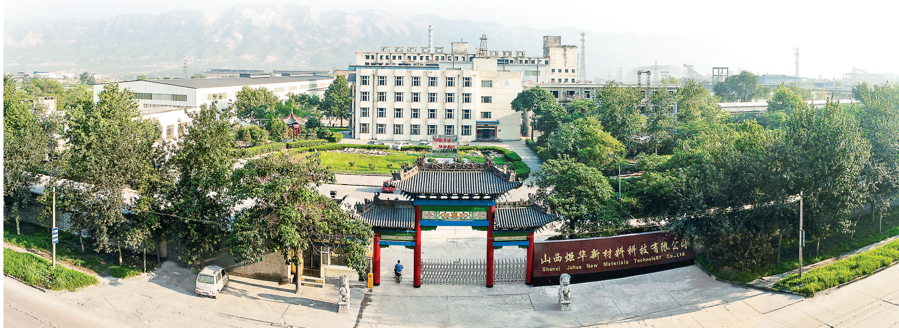
山西炬华新材料科技有限公司 Shanxi Juhua New Materials Technology Co., Ltd.