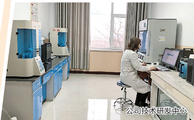
公司技术研发中心

山西炬华新材料科技有限公司,是河津市在2017年招商引资的高科技企业,是山西省“有色金属工业重点项目”、运城市“凤还巢”重点支持企业及河津市重点项目。2018年、2019年,该公司分别被山西省列为“有色金属工业重点项目”,以及河津市重点支持的“80项”“60项”重点项目之一,主要从事铝基催化新材料及高端氧化铝系列产品的研发、生产及销售,产品有普通活性氧化铝、大孔及超大孔拟薄水铝石、硅铝复合材料、铝基催化剂及载体等6大系列40多个品种,总产能约3万吨。产品可广泛应用于石油炼制过程中各种加氢催化剂和重整催化剂的制备;煤化工催化剂及化肥化工催化剂的制备;天然气脱硫及各种气体的脱毒、干燥、空分,以及双氧水行业的吸附剂、水处理方面的催化剂等。