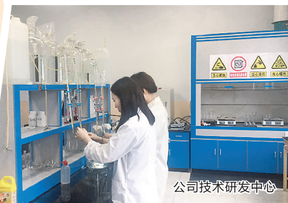
公司技术研发中心