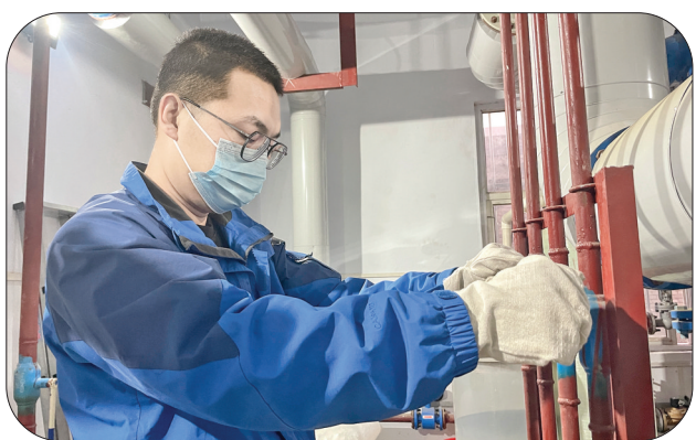
▲工作人员进行站内调节