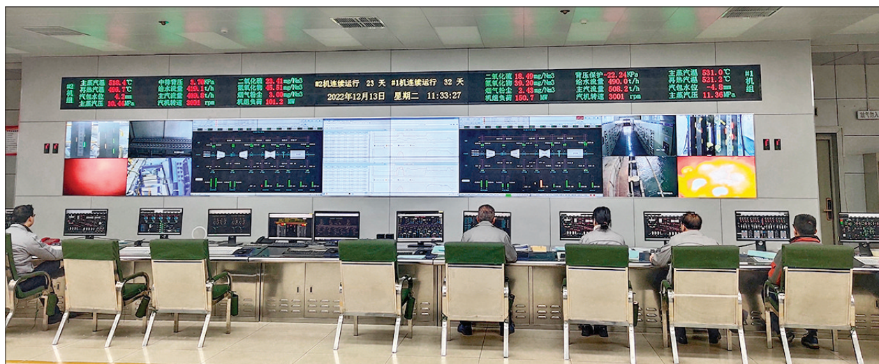
▲关铝热电有限公司热源稳定运行