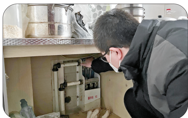
▲供热维修队上门服务

下一步,市城市管理局综合行政执法队将继续推进违章建筑拆除工作,不断提升城市品质,全力打造整洁、有序、安全的城市环境。