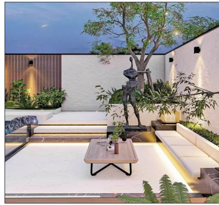
▲台阶灯饰渲染浪漫

户外灯具常使用地面草坪灯、墙面壁灯,或廊架屋檐的吊灯系列。此外,还应参考户外灯具的节能环保及安全性能。张红建议选择暖色调的光源,这样可以整个院子显得格格格外温馨。同时,引导视线与路径的台阶灯铺设,对于渲染神秘浪漫的庭院氛围和保证行走时的照明、安全,都起到了非常重要的作用。