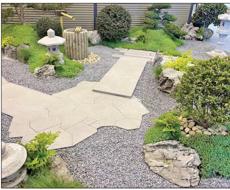
▲相近色系铺装更协调