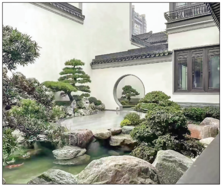
▲中式院子彰显闲适感