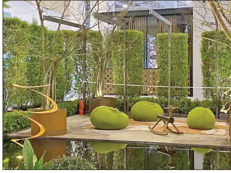
▲高大植物增加私密性