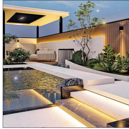
▲暖色光源设计更温馨