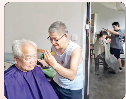
▲夫妻俩为父母修剪头发