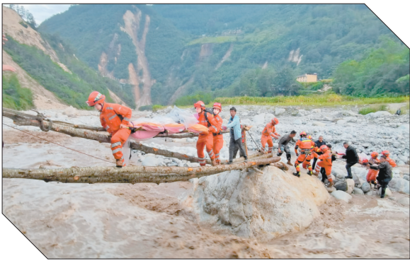
▲2022年9月5日，武警四川总队机动第二支队官兵在甘孜州泸定县磨西镇磨子沟村搭建临时木桥转移被困群众。