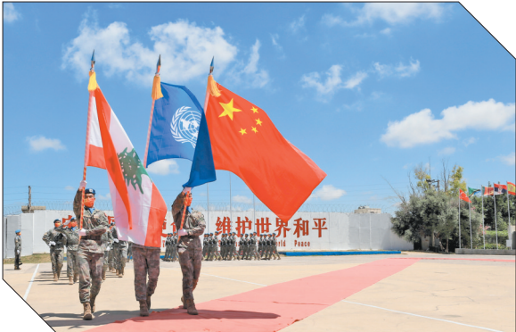
▲在黎巴嫩南部辛尼亚村的中国维和部队营区，中国维和部队官兵在受勋后通过观礼台（2022年7月1日摄）。