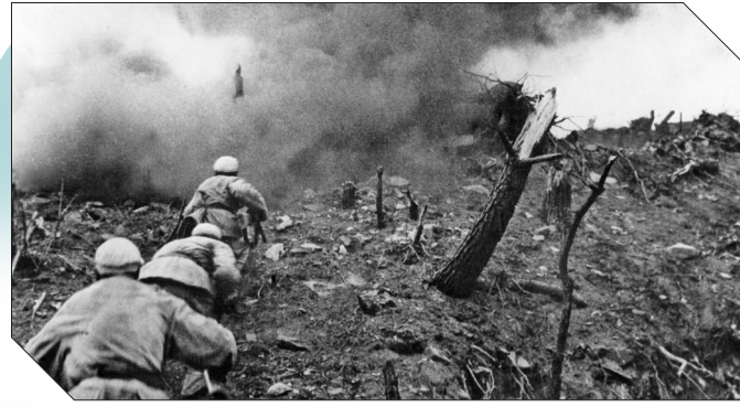
▲1952年，在上甘岭战役中，中国人民志愿军指战员在炮火支援下，攻上537.7高地北山。