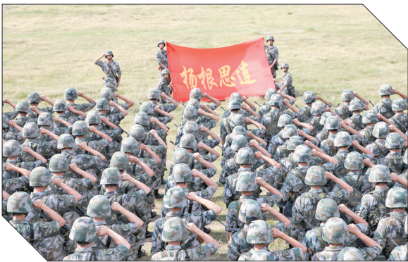
▲“杨根思连”官兵执行任务前向连旗宣誓（资料照片）。