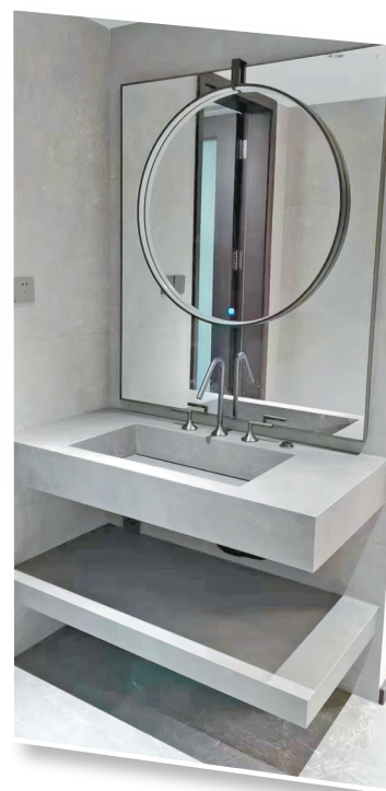
▲台面台盆相得益彰

原木风格注重简洁、舒适的布局。避免过多的装饰和复杂的设计,保持空间的自然流畅。合理利用空间,注重家具的摆放位置和大小,以确保居室舒适实用。