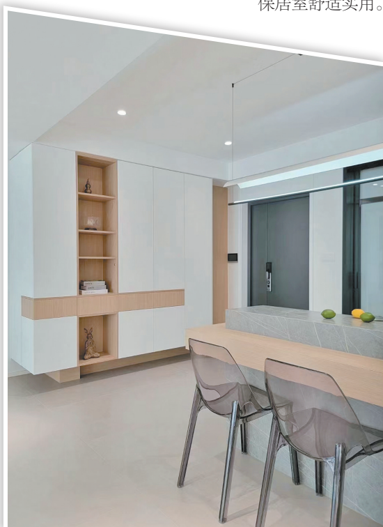
▲收纳分区设计美观实用