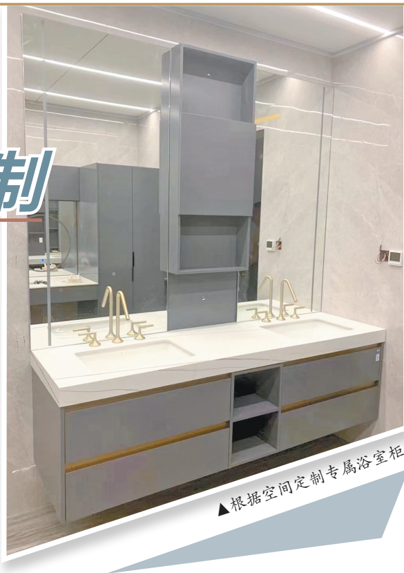
▲根据空间定制专属浴室柜