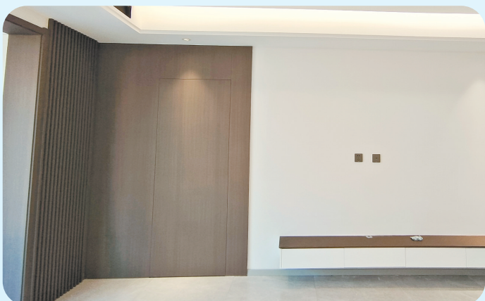
▲门融于墙配以线条不单调