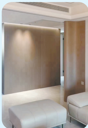
▲隐形门在窄墙面的应用