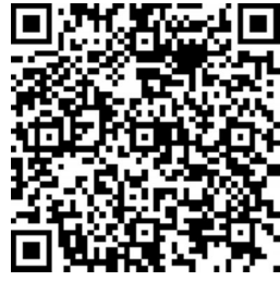
▲扫描二维码,可查看详细图解步骤。