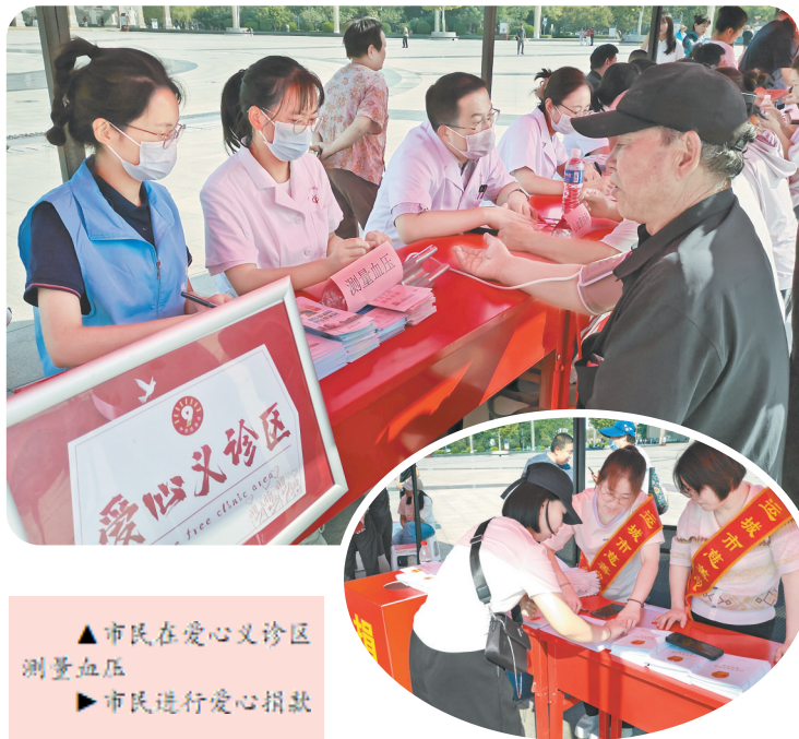
▲市民在爱心义诊区测量血压 ▶市民进行爱心捐款

当天,活动现场设置了慈善义卖区、爱心互动区、爱心义诊区等多个区域。在爱心义诊区,市中心医院各科室的专家为过往市民提供义诊服务,免费测量血糖、血压等。在爱心互动区,志愿者和社工引导市民积极参与幸运投壶、慈善拼贴等互动游戏,让大家以游戏闯关的形式了解慈善知识,携手参与慈善。同时,书法爱好者还为爱心人士、市民免费赠送了书法作品。此外,现场还布置了慈善文