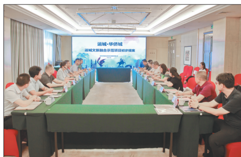
▲座谈会现场

展布局。实地考察结束后,召开座谈会。会上,市文旅局相关负责人讲解了文旅产业资源现状、发展布局和区位优势。深圳华侨城文化旅游科技集团和中交建筑集团相关负责人对各自的品牌优势进行了介绍,并对“运城·华侨城文旅融合示范项目”概念规划及投资运营模式进行概述。各参会单位对项目选址、合作模式、发展趋势等进行交流。