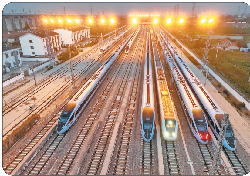
▲10月10日,动车组列车停在江苏省连云港市境内存车场等待发车(无人机照片)。10月11日零时起,全国铁路将实行第四季度列车运行图。

此外,铁路部门充分运用甬广、沪宁沿江高铁开通新增能力优化东南沿海高铁网运行图,服务海峡两岸经济区