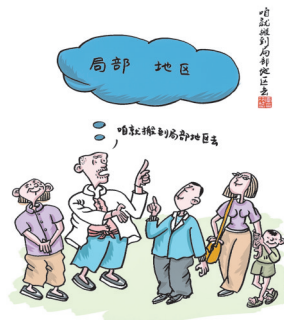
插图《咱就搬到局部地区去》

运城晚报讯(记者 薛丽娟)由政协万荣县委员会编著、山西出版传媒集团山西人民出版社出版的《万荣笑话》，近日正式发行。 万荣笑话，是我国首批国家级非物质文化遗产，以万荣“七十二zeng”为基础，历经千人创编、万人传诵，不断挖掘、创造和完善，逐渐成为扎根于黄汾交汇处、峨嵋岭黄土地上的一枝幽默之花，成为走出万荣、响彻河东、名播全国的亮丽文化品牌。