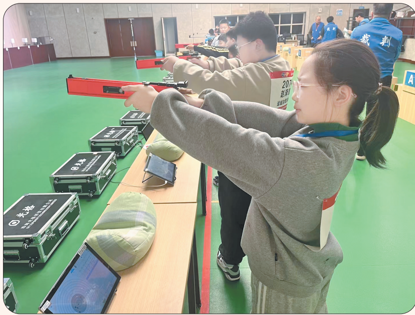
▲运城向阳学校射击队选手沉着应战

成绩的背后离不开该校射击队孩子们日复一日的艰苦训练,射击馆内深夜的灯火、操场上脚下的汗水,每一