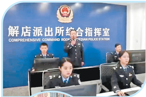
综合指挥室整体防控