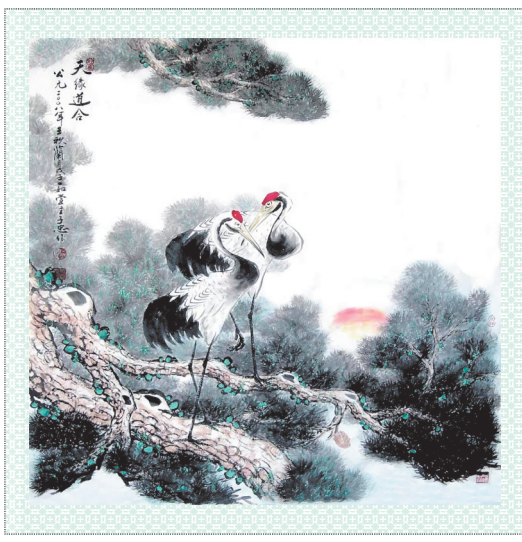
▲天缘道合 ▼马到功成