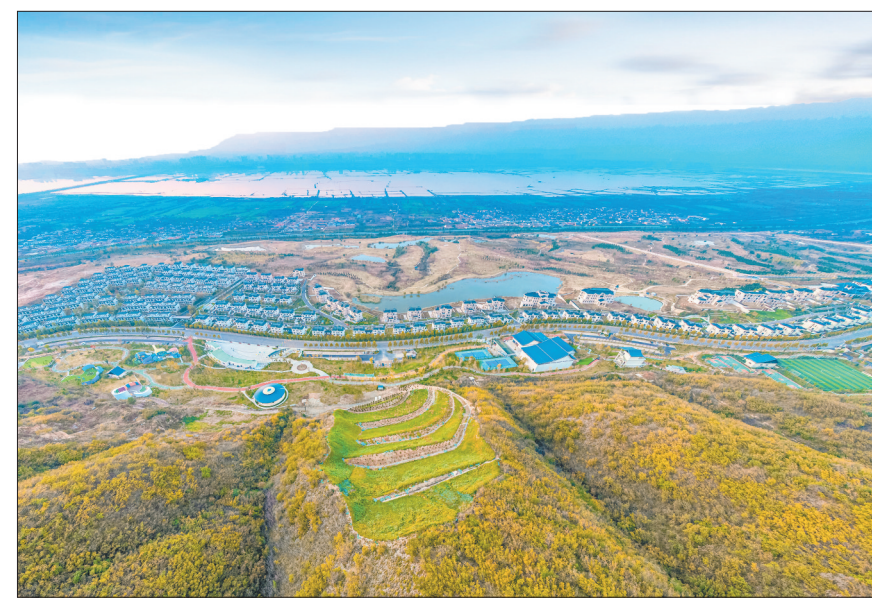
组图为了修复完成后的破损山体生态修复工程项目：凤凰谷入口废弃矿山(DK23)治理区。 记者 陈方斌 摄于秋天

从2022年8月开始，我市开始对南山新境市民广场南侧3处山体进行修复，该项目由运城市盐湖区建设投资有限公司（以下简称“盐湖建投”）实施。