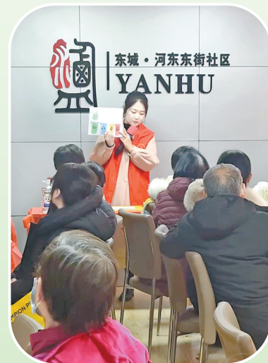
▲河东东街社区开展垃圾分类知识讲座

本次活动丰富了辖区居民的生活,同时也号召更多居民积极参与到垃圾分类的行动中来,争做垃圾分类的实践者、推动者、宣传者。社区相关负责人表示,今后会继续开展垃圾分类的宣传和引导工作,促进居民养成生活垃圾分类的良好习惯和“绿色、低碳、环保”的生活理念。