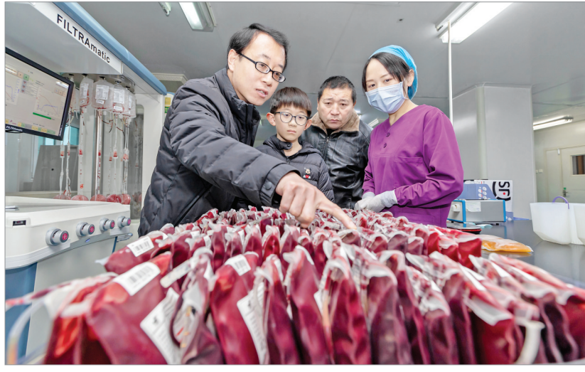
▲1月20日,参与人员在运城市中心血站参观。