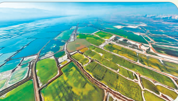
▲盐湖是镶嵌在河东大地上的这颗明珠，星罗棋布的盐池是盐湖的一大独特景观。