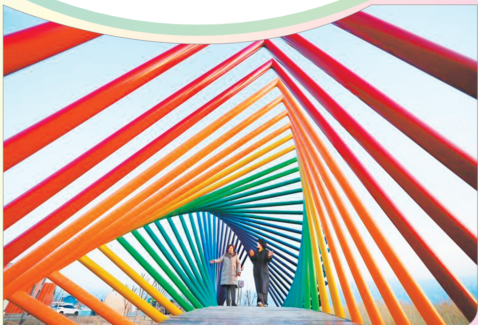
▼市民在河东成语典故园游览。该成语典故园与周边中条山和盐湖多个旅游休闲景点串联起来，丰富了旅游度假区经营业态。