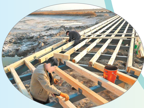
▲工人在修建环湖廊道。近年来，运城市实施盐湖堤埝除险加固、湖区清淤治污、周边绿化生态修复等，让盐湖恢复应有的生态面貌。