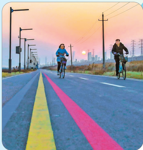
▲市民在“七彩盐湖”绿道骑行。运城市高标准实施环湖绿道、湿地公园、水系连通、亲水项目等工程，全力打造水清河畅、岸绿景美的良好生态环境。