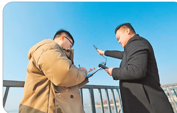
▲盐湖生态保护与开发中心工作人员开展空气监测，为盐湖生态环境监测和保护提供重要数据和信息。