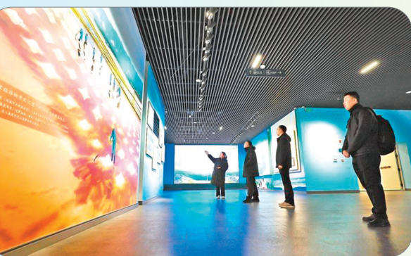
▲观众在河东池盐博物馆参观。伴随着盐湖生态修复，参观博物馆成了游客的必游路线。