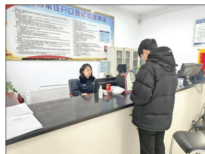
民警为学生办理身份证

了解这一情况后,户籍民警抽出周末休息时间,为同学们开通绿色通道。在办理身份证过程中,户籍民警为学生们核对身份信息、拍照、录入身份信息和指纹信息,并耐心解答学生在办证方