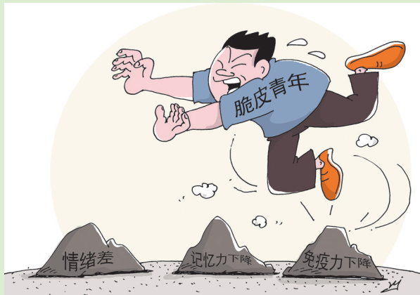
请，提高自身「免疫力」

你贴上“脆皮青年”的标签了吗？情绪低、免疫力下降、心理承受力差，你太脆了，真为你担忧。世上本无事，庸人自扰之。请你放下心里“包袱”，多参加体育锻炼，让身心放松一些；少刷视频，走出户外，收获健康。