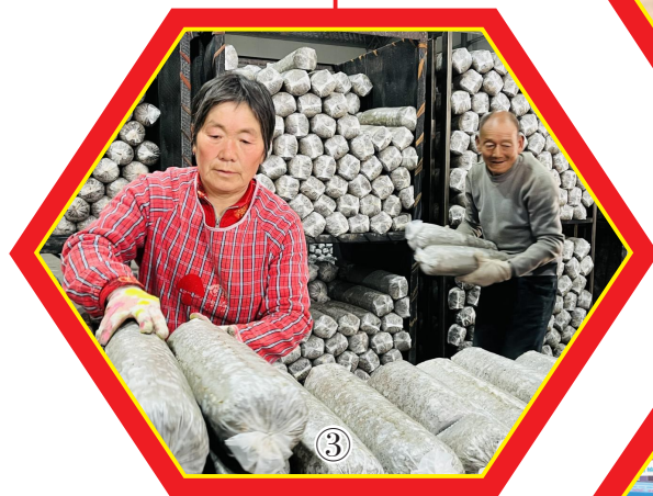
▲2月18日，垣曲县皋落乡娟娟种植专业合作社工作人员在抢抓香菇菌棒。新春伊始，该合作社工人们以饱满的热情和昂扬的精神快速投入工作，确保在天气回暖之前完成香菇菌棒制作。