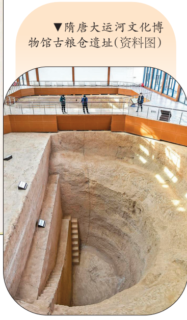
▼隋唐大运河文化博物馆古粮仓遗址(资料图)

的中央机构。《贞观政要·旧唐书》有“安民政，莫此为先”之说，历经隋末战乱后，李世民提出了“矜恤民困”的重民思想，认为“为君之道，必须先存百姓”，因而户部的工作受到了唐朝统治者的高度重视。尤为值得一提的是，这个时期特别重视救灾制度的建设，初步建立了全国性的救灾备荒的仓储体系，实施了赈灾、调粟、养恤、减租免征等改善民生的措施。