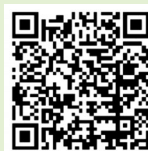
扫码获取运城市主城区三轮车禁限行区域示意图