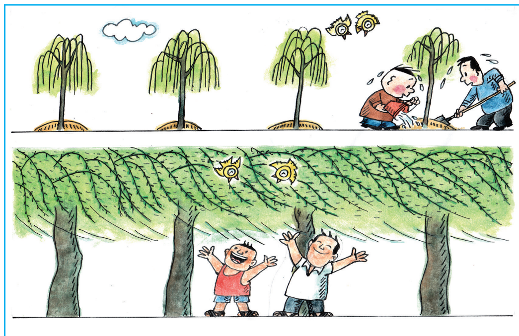
春种一行柳 夏收十里风