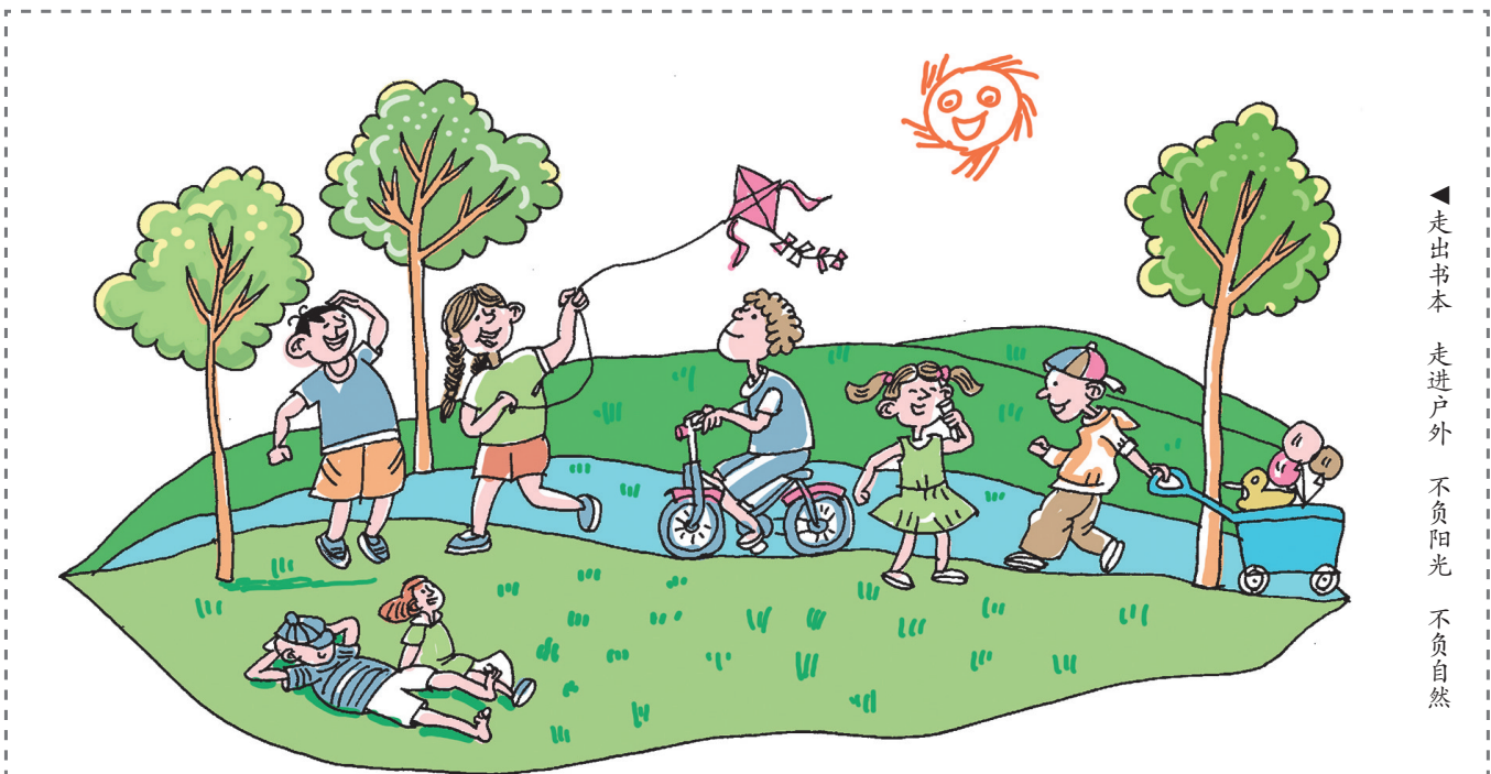
走出书本 走进户外 不负阳光 不负自然