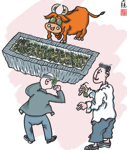
▲ 卫行智 作

根娃爹买了一头犏牛，没想到这头牛不好好吃干草，总是要挑青草吃。为此，根娃爹整天愁眉不展，心想：咱哪有那么多青草喂它？ 这天，根娃知道后就拿出自己的一副墨镜递给他爹，对他爹说：“爹，你把它给牛戴上，它不就看不出是青草还是干草了吗？” 根娃爹看看手里的墨镜，高兴地对根娃说：“你这娃，咋不早说还有这办法哩？早说的话，我就把你妈晒的干草叶全给牛吃啦！”