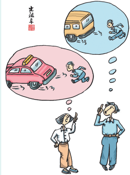
▲ 卫行智 作