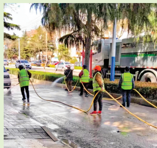
▲环卫工人清洗街道

常态清扫擦亮城市“面子”，精细化管理洗净城市“里子”，城市面貌焕然一新。该中心相关负责人表示，下一步，该中心将紧紧围绕创建全国文明城市的目标，持续深入开展城市环境卫生提质增效工作，推动永济市市容环境再上新台阶。