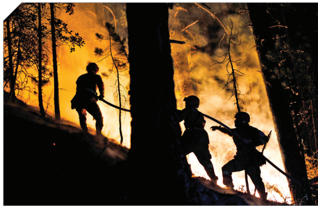
▲3月21日,四川省森林消防总队消防员在火场扑救山火。据四川省甘孜藏族自治州雅江县“3·15”森林火灾处置指挥部消息,截至3月26日15时,雅江县森林火灾现场已无明火,经指挥部联合会商研判,火场全面进入清理看守阶段,部分扑火队伍正按安排有序撤离归建。