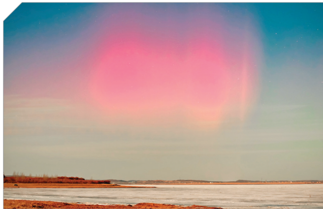
▲这是3月25日凌晨在黑龙江省讷河市拍摄的极光景象。