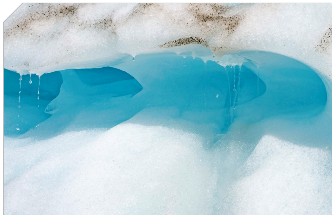
▲这是3月24日拍摄的新西兰南岛西海岸福克斯冰川一隅。新西兰大气及水资源研究院25日公布的一项研究称,刚刚结束的年度测绘表明,由于全球变暖导致高山雪线持续上移,积雪区面积持续减少,新西兰的冰川正在变得支离破碎、退缩消融。