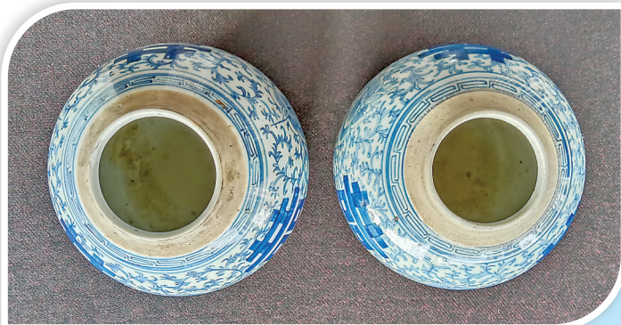
▲此对喜字罐，盖已丢失，口沿位置没有釉色。