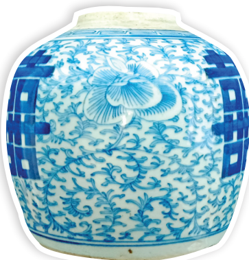
▲罐体上的缠枝莲纹细腻优雅