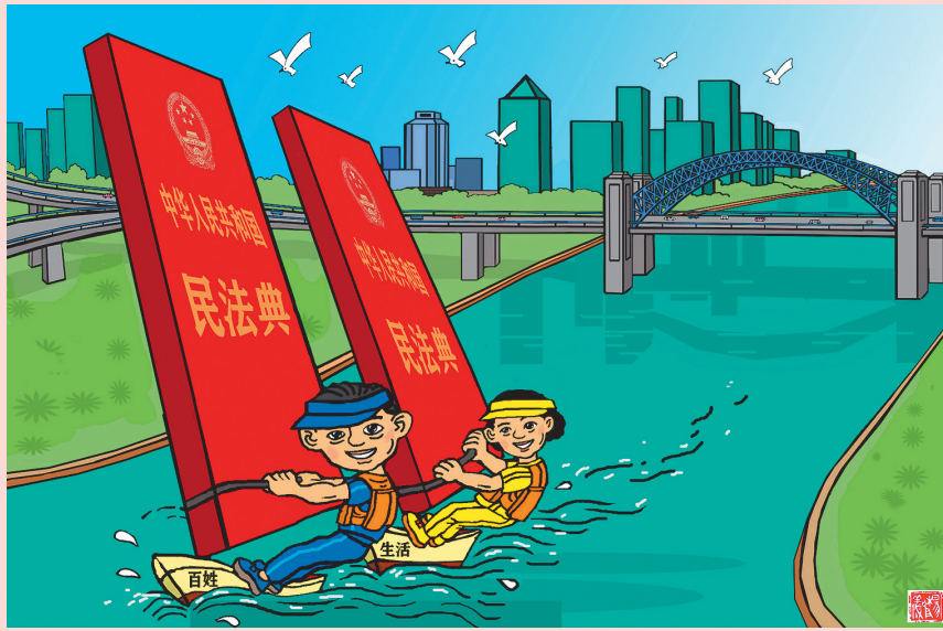
▲为百姓扬起民生的风帆