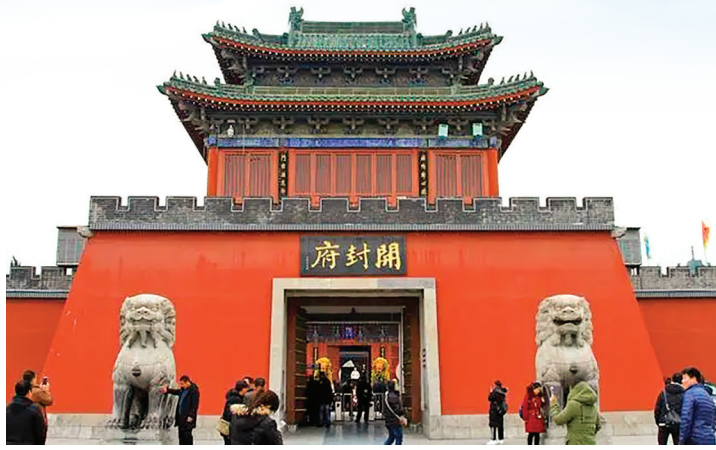
现代开元封府景区（资料图）

安石变法中的一项重要内容。王安石推行市易法，设置市易司、市易务，将政府各类采购行为进一步集中统一管理。《宋会要辑稿》记载，熙宁五年（公元1072年）“上供荐席、黄芦之类六十色，凡系百余州供送，不胜科扰。乞计钱数，从本务召人承揽，以便民也”，这次集中采购的物资多达60个品种，采取的所谓“承揽”方式，是一种在招标基础上的总承包采购办法。