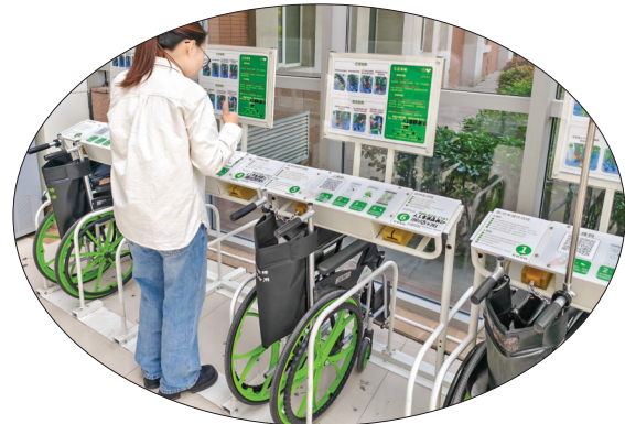
▲4月14日,一名市民查看如何使用共享轮椅。

据悉,目前全院共投放共享轮椅60辆、共享平车18辆,并安排专人进行定期消毒和维护。随后,该院还将根据实际需求在医院其他点位陆续投放共享轮椅、共享平车,以方便来院群众使用。