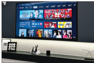
▲小智管家可开电视

安装也很简单，撕下背后的3M胶贴，把它贴到大门平坦、连得上家中Wifi的位置就好。另外，如果有人想拆除门铃，它会在第一时间发出刺耳警报声，并通过App消息提醒。