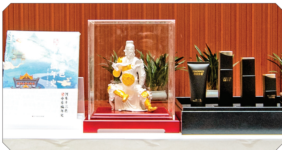
▲部分文创产品展示