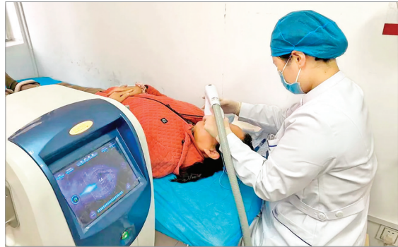
▲患者在该院接受治疗

为满足广大干眼患者规范化、专业化的诊疗需求,市中心医院于日前开设了干眼门诊。门诊时间为每周三,地点在市中心医院东院门诊大厅三楼眼科诊区。主要治疗项目有:睑板腺按摩+结膜囊冲洗、IPL强脉冲光治疗。