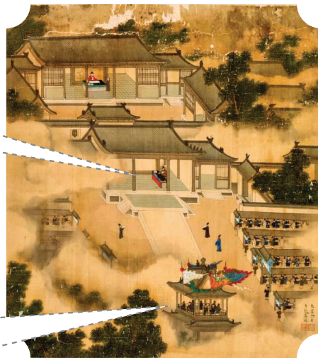
明代余士、吴钺作品《徐显卿宦迹图·棘院秉衡》局部

明代余士和吴钺共同绘制的图册《徐显卿宦迹图》，记录了明万历年间吏部右侍郎徐显卿的为官业绩，现存26开，每开纵62厘米、横58.5厘米，现藏于故宫博物院，其中第11开为《棘院秉衡》。棘院，即古代开科取士的地方贡院，因贡院用荆棘遍置围墙，故名。秉衡，则寓意秉公无私。此图表现了徐显卿公平公正主持科举考试之事，从中也可看出北京贡院的建筑风貌和科举考试的情景。