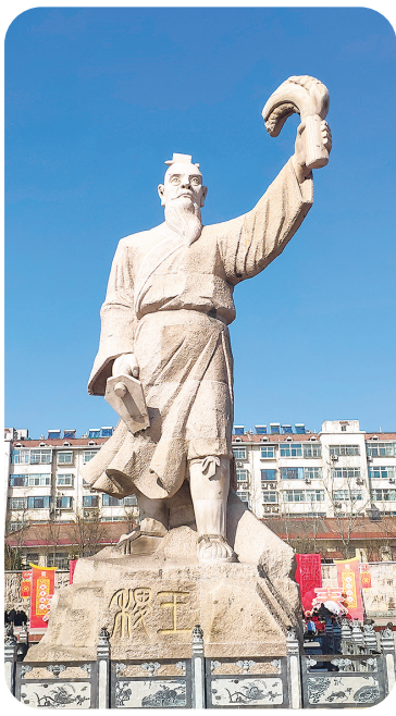
▲稷山县稷王文化广场“稷王”雕像

秦穆公可算是“春秋五霸”中的厚道人,若要论起“厚黑”,非勾践莫属。早年在战胜越国后,夫差曾自信自己的战术才能,挥兵北上。虽百战百捷,却并未能获取足够的土地和人口来填补损失。北上争霸消耗了吴国大量的国力和物资,加上夫差生活奢侈,只好打起