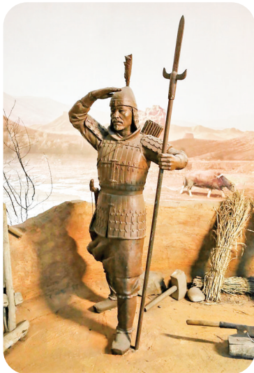
▲汉代军屯守边士兵雕像 (资料图)

了越国的主意。为了保证来年的战备物资,夫差向越国讨要种子,勾践等越国君臣毫不犹豫地大量蒸熟的种子混入良种之中上缴给吴国——这可算最早的无差别生物战了。秦穆公当然知道自己小舅子的人品有多差,他为晋国提供粮食是为了救济晋国的百姓;勾践为了复仇,却丝毫不顾吴国普通百姓的死活,“厚黑”程度可见一斑。越国提供的“伪劣”种子加重了吴国的困难,此时夫差仍被虚荣迷住双眼,渐渐地,吴国走向灭亡。