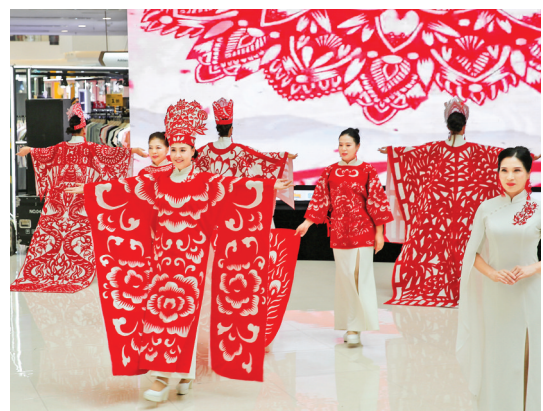
▲ 剪纸邂逅旗袍,展示别样美好。