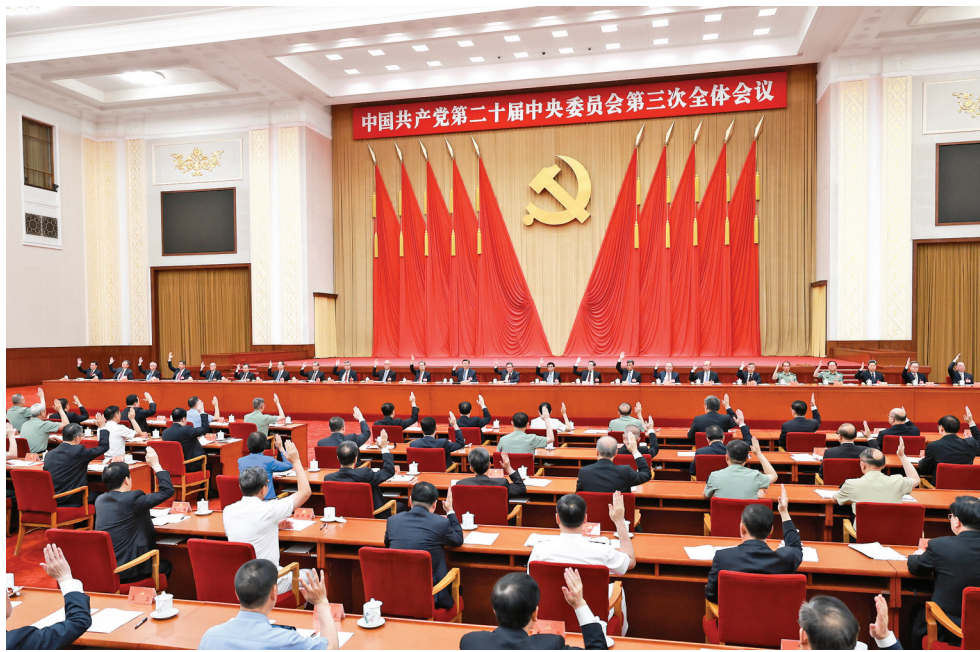
▲中国共产党第二十届中央委员会第三次全体会议,于2024年7月15日至18日在北京举行。中央委员会总书记习近平作重要讲话。