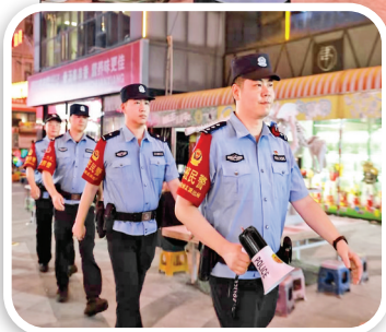
◀护航街头巷尾 ▲发放宣传资料

夏季来临,各类“情绪中暑”症状频发,一言不合就翻脸动手。近日,从运城警方获悉,自“夏季行动”开展以来,警方持续加大寻衅滋事、打架斗殴等违法犯罪行为的打击力度。其间,就有多人因打架斗殴被公安机关处理。在此,警方也提醒广大市民,你以为打几拳或是撒个酒疯没啥大不了,其实这个违法犯罪行为的“成本”很高。