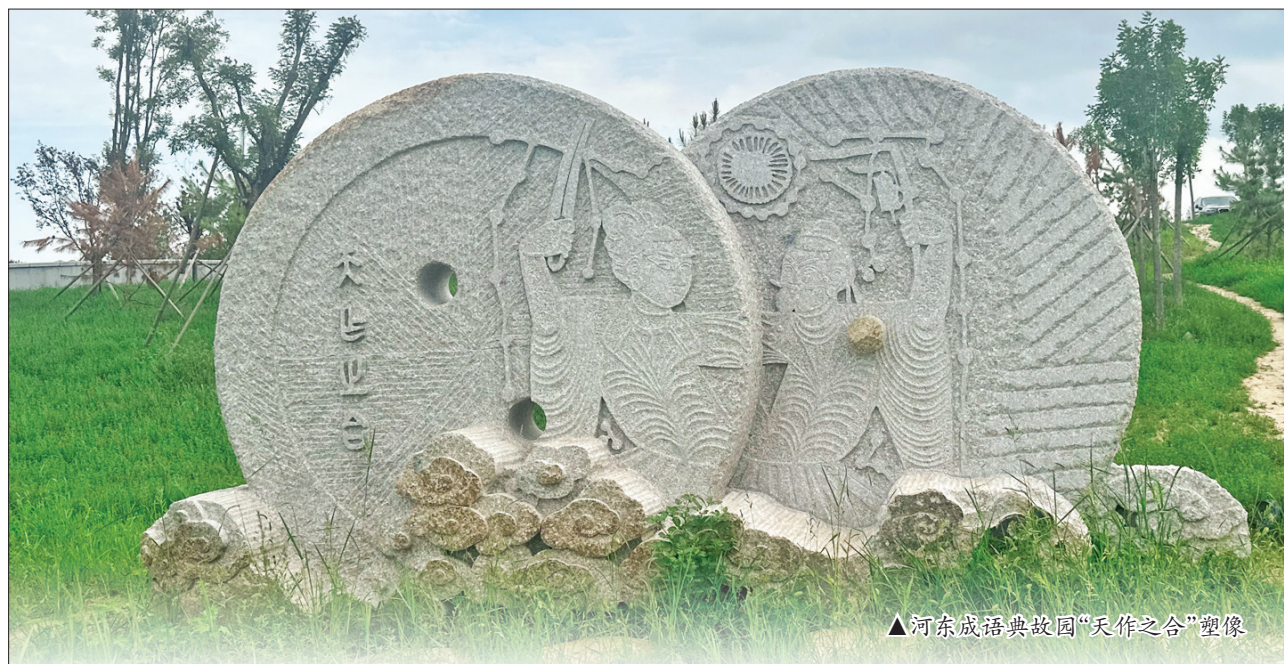
▲河东成语典故园“天作之合”塑像