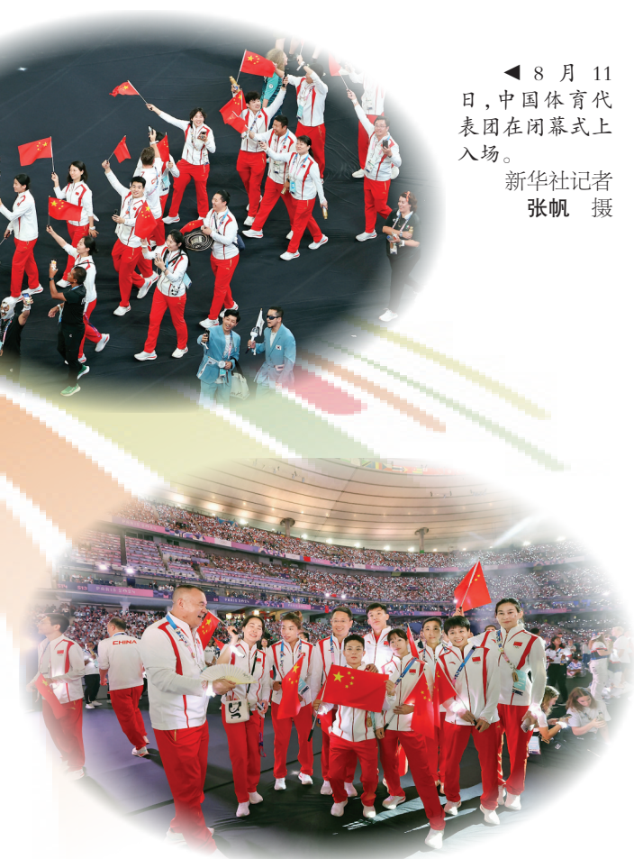
▲8月11日,中国体育代表团在闭幕式上入场。