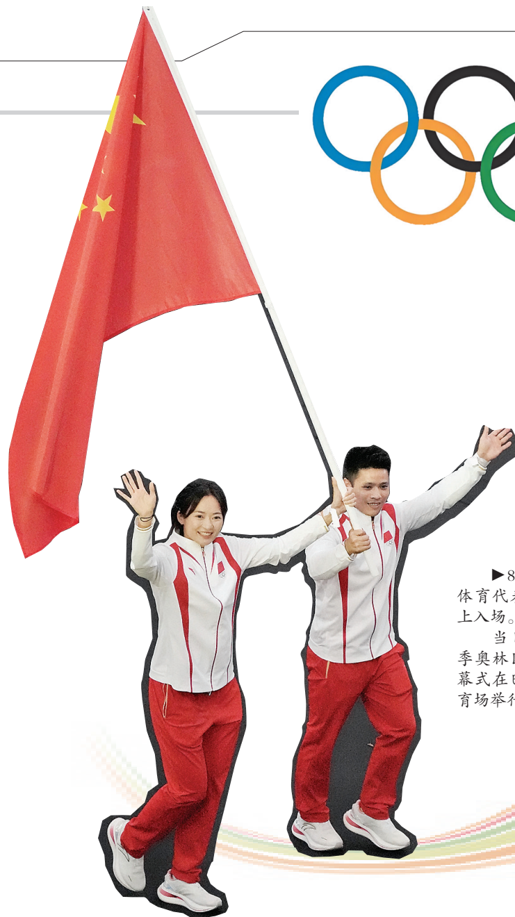
▲8月11日,中国体育代表团在闭幕式上入场。 当日,第33届夏季奥林匹克运动会闭幕式在巴黎法兰西体育场举行。