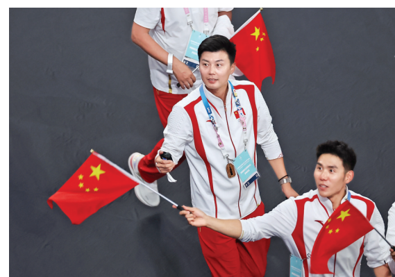
▲8月11日,中国体育代表团成员在闭幕式上入场。