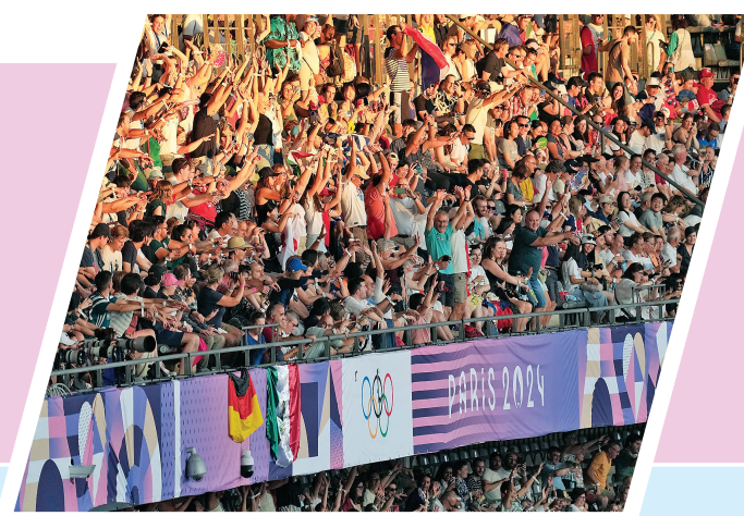
▲8月11日,这是闭幕式现场。