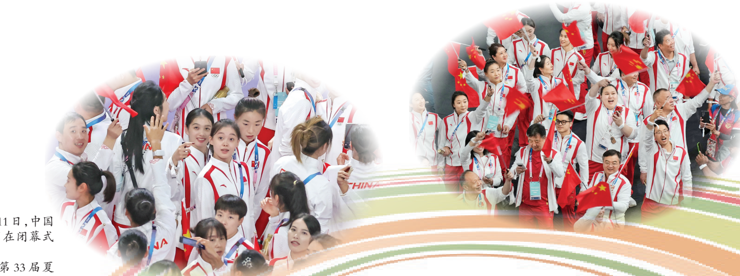
▲8月11日,中国体育代表团在闭幕式上入场。