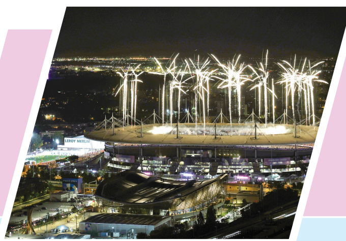
▲这是8月11日拍摄的闭幕式上的焰火表演。