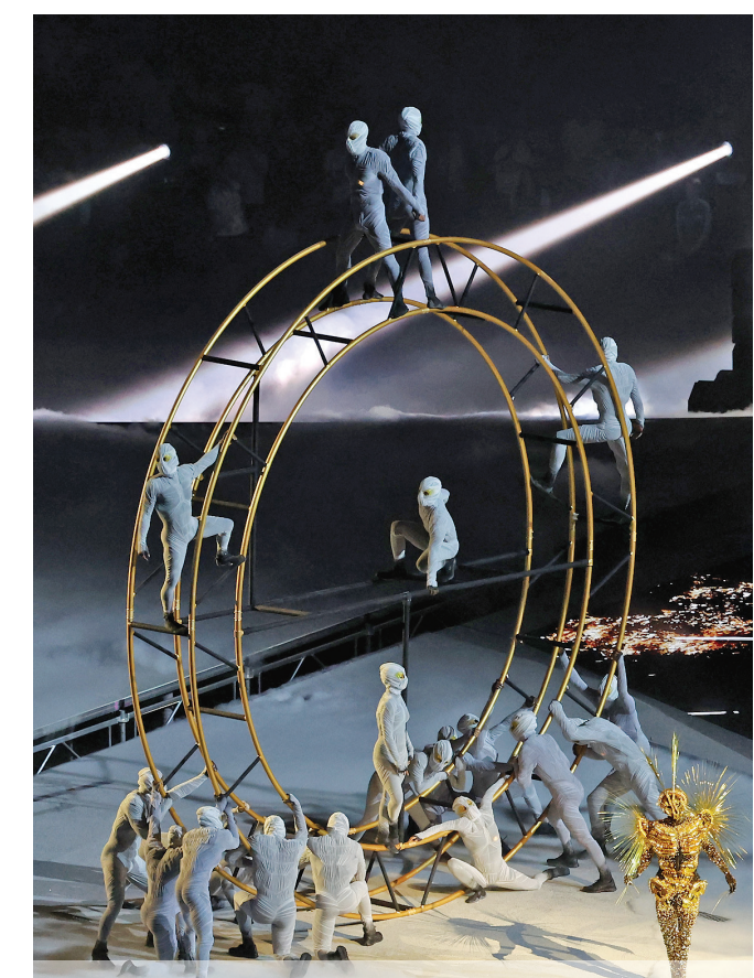
8月11日,演员在闭幕式上表演。