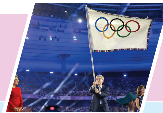
▲8月11日,这是闭幕式上的国际奥委会会旗交接仪式。