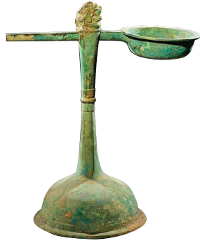
▲东汉刻度天禄架铜熨斗(邯郸市博物馆收藏)

从已有的考古发现来看,到了汉代,随着我国养蚕缫丝和青铜铸造的发展,熨斗作为熨烫衣服的工具开始兴起,成为宫廷或贵族的日常用品。