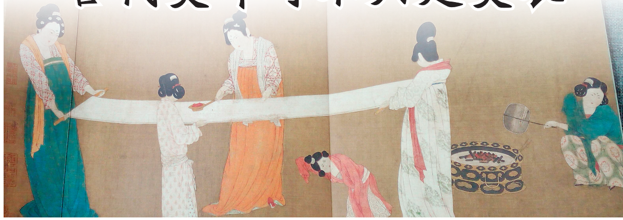
▲唐代张萱《捣练图》(局部),其中就描画有仕女手持熨斗的场景。

巴黎奥运会于当地时间11日落幕。奥运会期间,除了精彩的比赛外,各国运动员的队服也可圈可点。其中,中国体育代表团的领奖服由环保再生纤维打造而成,在抗皱等方面具有良好性能。在没有化纤材料的古代,中国老百姓的衣服主要由棉、麻、丝等材料制成,抗皱性较差。