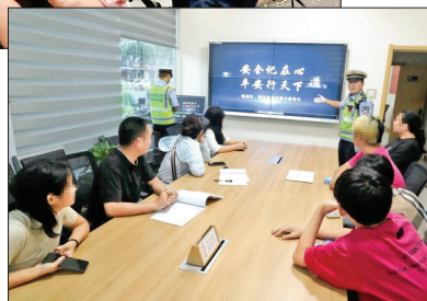
▲ 观看交通安全教育片

友圈”为例，盐湖交警大队结合本地实际，通过设立交通规则学习点、让违规驾驶人发微信朋友圈集赞等方式，督促市民养成佩戴安全头盔、使用安全带的习惯，克服麻痹大意的思想。